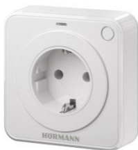
Bild 4: Das Hörmann BiSecur Funksystem wurde um weitere Funktionen ergänzt: der Tor- und Türhersteller bietet ab Herbst Innentaster und Steckdosen-Empfänger, mit denen neben den Hörmann Antrieben auch beispielsweise Lampen und sonstige Elektrogeräte betätigt werden können.

Download Texte und Bilder: www.hoermann.de/presse