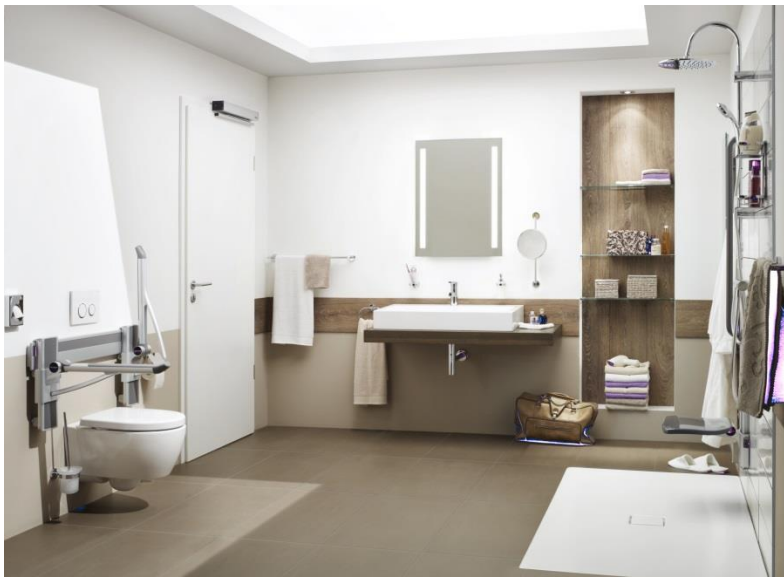
Bild 3: Zu einem barrierefreien Badezimmer gehört nicht nur eine ebenerdige Dusche und ein behindertengerechtes WC, sondern ebenso eine per PortaMatic Antrieb automatisch betriebene Tür, die Rollstuhlfahrern oder Menschen mit Rollator das Badezimmer zugänglich macht.

Bild 2: Der Innentürantrieb PortaMatic von Hörmann eignet sich je nach Türgröße für Holz- und Stahltüren und kann über Wandtaster, Handsender oder die Hörmann BiSecur APP betätigt werden. Auf Antrag ist ein Zuschuss bis zu 100 Prozent durch die Pflegeversicherung möglich.