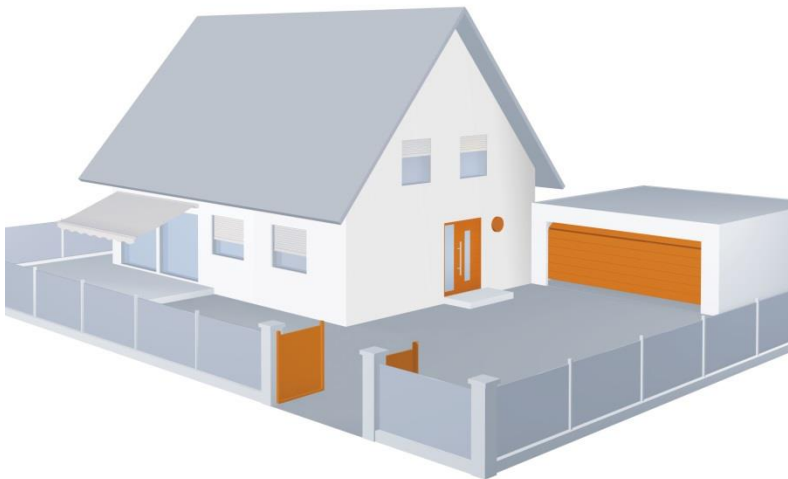
Bild 5: Der Hörmann Türantrieb PortaMatic lässt sich mit der von Hörmann entwickelten BiSecur Funktechnik bedienen, die auch zum Betätigen der Haustür, des Garagen- und Hof-tors sowie weiteren Elektrogeräten oder der Beleuchtung verwendet wird. So können diese alle über einen einzigen

Bild 4: Der Türantrieb PortaMatic von Hörmann eignet sich auch als komfortable Lösung in modernen Eigenheimen. Mit schweren Einkaufstaschen oder einem Tablett in den Händen sind automatisch betätigte Türen eine große Erleichterung im Alltag.